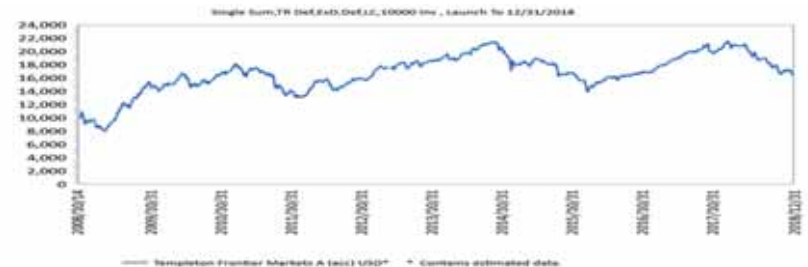
成立以來投資成長圖(期初單筆投資一萬元、原幣計價迄2018/12月底,資料來源:理柏)