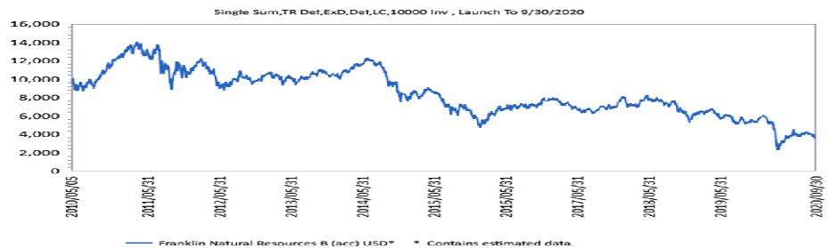
成立以來投資成長圖(期初單筆投資一萬元、原幣計價迄2020/9月底)